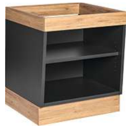
Buffettisch Valinta XL Wandelement klein 72.2x81x70 cm (BxHxT) anthrazit/eiche 30222569