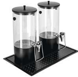
Dispenser Hampton doppelt GN 1/1 inkl. 4x Kühlakku 53x32.5x42 cm (LxBxH) 8 l schwarz 30188232