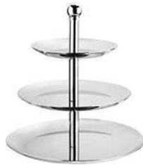
Etagere Anie 26.7x30.5 cm (ØxH) silber 30051447