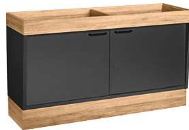
Buffettisch Valinta Wandelement groß mit Türen 140x81x47.5 cm (BxHxT) anthrazit/eiche 30232478