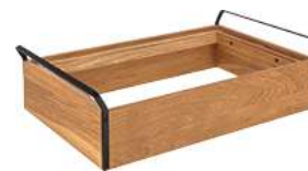
Grundbox Esino mittel GN 1/1 61.9x38.6x16.9 cm (LxBxH) braun/schwarz 30241078