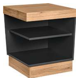
Buffettisch Valinta XL Eckelement 70x81x70 cm (BxHxT) anthrazit/eiche 30222558