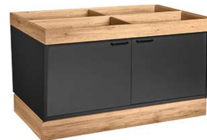
Buffettisch Valinta Inselelement groß mit Türen 140x81x93.2 cm (BxHxT) anthrazit/eiche 30232481