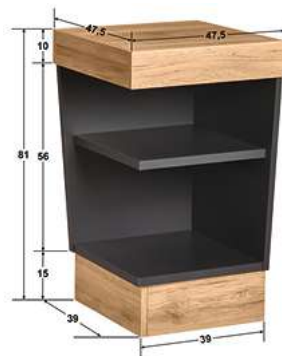
Buffettisch Valinta Eckelement 47.5x81x47.5 cm (BxHxT) anthrazit/eiche 30129656