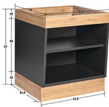
Buffettstisch Valinta XL Wandelement klein 72.2x81x70 cm (BxHxT) anthrazit/eiche 30222569