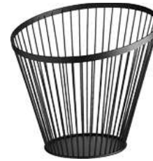
Brotkorb Alpena 28x26 cm (ØxH) schwarz 30047208