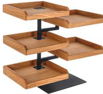
Etagere Esino 5-stöckig 46.8x41.8x24 cm (BxHxT) braun/schwarz 30241084