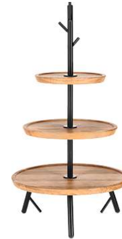
Etagere Cornu 3-stöckig 34.8x62.8 cm (ØxH) eiche/schwarz 30130448