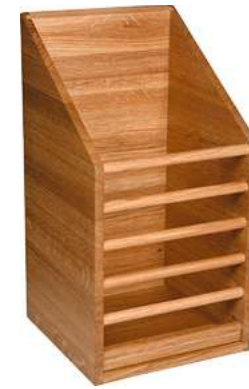
Baguettekorb Mana 24x24x45 cm (LxBxH) eiche 10040114