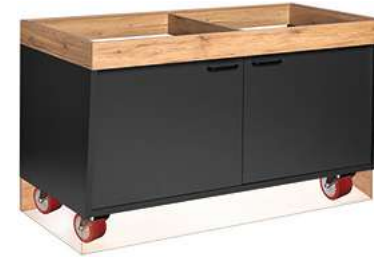
Buffettisch Valinta XL Wandelement groß fahrbar mit Türen 140x81x70 cm (BxHxT) anthrazit/eiche 30222571