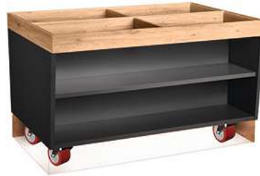
Buffettisch Valinta Inselelement groß fahrbar 140x81x93.2 cm (BxHxT) anthrazit/eiche 30134127