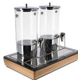
Saftspender Montana eiche doppelt 1/1 55.4x35.2x53 cm (LxBxH) eiche/transparent/ edelstahl 30067124