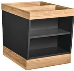
Buffettisch Valinta Inselelement klein 72.2x81x93.2 cm (BxHxT) anthrazit/eiche 30129665