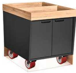
Buffettisch Valinta Inselelement klein fahrbar mit Türen 72.2x81x93.2 cm (BxHxT) anthrazit/eiche 30232477