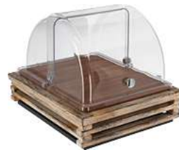
Kühlvitrine Natchez Holz 1/2 37x31x27.7 cm (LxBxH) vintage weiß/ transparent/eiche 30067209