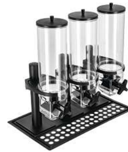
Müslidispenser Hamshire dreifach GN 1/1 53x32.5x56.2 cm (LxBxH) 12 l schwarz 30188241