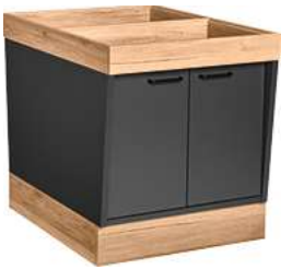
Buffettisch Valinta Inselelement klein mit Türen 72.2x81x93.2 cm (BxHxT) anthrazit/eiche 30232475