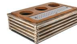
Karaffenstation Natchez 1/1 57.5x37x18.3 cm (LxBxH) vintage weiß/ edelstahl/eiche 30067107