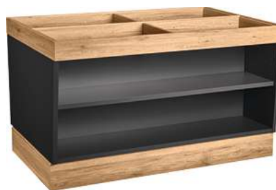
Buffettisch Valinta Inselelement groß 140x81x93.2 cm (BxHxT) anthrazit/eiche 30129719

Perfekt für die Raummitte. Gefertigt aus robustem, pflegeleichtem Holzwerkstoff, vereint das Inselelement Langlebigkeit mit ansprechender Funktionalität. Es lässt sich individuell mit drei verschiedenen Einlegeplatten, Hygieneschutz und einer Nischenwand konfigurieren (alles separat erhältlich, siehe Seite 22). Der Boden sowie die höhenverstellbaren Fachböden bieten einen umfangreichen Stauraum. Die Kabelöffnung sorgt für eine unkomplizierte Zu- oder Ableitung für Stromkabel und Wasserleitungen. Neben den höhenverstellbaren Sockelgleitern ist das Inselelement auch mit einer optionalen Rollenfunktion erhältlich, die für eine erhöhte Flexibilität sorgt. Dazu können auf Wunsch Drehtüren angebracht werden.