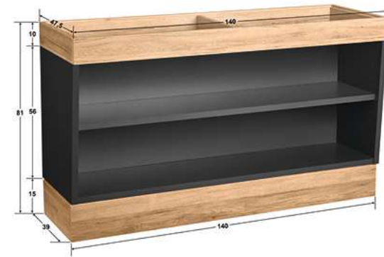
Buffettisch Valinta Wandelement groß 140x81x47.5 cm (BxHxT) anthrazit/eiche 30129667