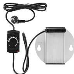
Elektroheizung Midland 22x4 cm (ØxH) schwarz 30047253