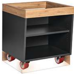
Buffettisch Valinta XL Wandelement klein fahrbar 72.2x81x70 cm (BxHxT) anthrazit/eiche 30222557