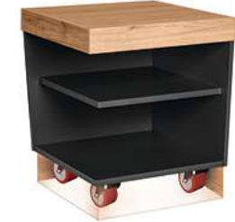
Buffettisch Valinta XL Eckelement fahrbar 70x81x70 cm (BxHxT) anthrazit/eiche 30222565