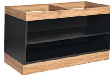
Buffettisch Valinta XL Wandelement groß 140x81x70 cm (BxHxT) anthrazit/eiche 30222562