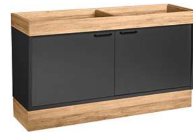
Buffettisch Valinta Wandelement groß mit Türen 140x81x47.5 cm (BxHxT) anthrazit/eiche 30232478