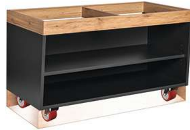
Buffettisch Valinta XL Wandelement groß fahrbar 140x81x70 cm (BxHxT) anthrazit/eiche 30222570