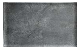
Platte Clawson mit Rand 53x32.5x2 cm (LxBxH) grau 30045650