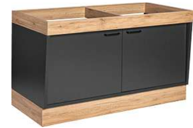
Buffettisch Valinta XL Wandelement groß mit Türen 140x81x70 cm (BxHxT) anthrazit/eiche 30222572