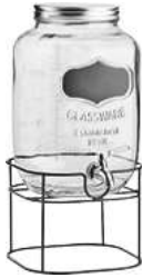
Getränkespender Modesto mit Ständer 21x44x18 cm (BxHxT) 7 l schwarz/transparent 30030672