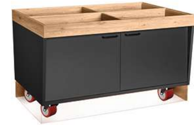
Buffettisch Valinta Inselement groß fahrbar mit Türen 140x81x93.2 cm (BxHxT) anthrazit/eiche 30232482