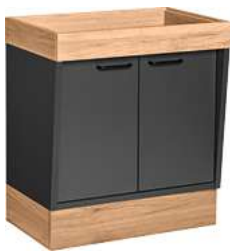
Buffettisch Valinta Wandelement klein mit Türen 72.2x81x47.5 cm (BxHxT) anthrazit/eiche 30232238