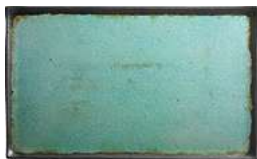
Platte Dearborn mit Rand 53x32.5x2 cm (LxBxH) türkis 30045719