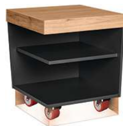
Buffettisch Valinta XL Eckelement fahrbar 70x81x70 cm (BxHxT) anthrazit/eiche 30222565