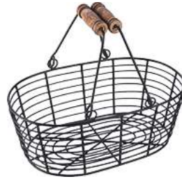
Korb Berena mit Griff 31x20x14 cm (LxBxH) schwarz 30001725