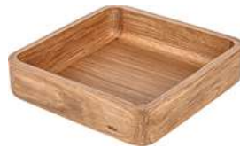
Schale Fenra 25x25x6.15 cm (LxBxH) eiche 30129636