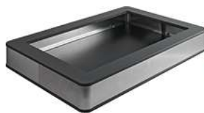
Grundbox Fundale flach GN 1/1 63x42.5x8.5 cm (LxBxH) anthrazit 10006307