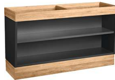
Buffettisch Valinta Wandelement groß 140x81x47.5 cm (BxHxT) anthrazit/eiche 30129667