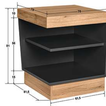
Buffettstisch Valinta XL Eckelement 70x81x70 cm (BxHxT) anthrazit/eiche 30222558

Die XL-Elemente sind ebenfalls in zwei Längen und dem passenden Eckelement erhältlich und bieten Ihren Gästen eine größere Abstellfläche für Teller, Tassen, Brotkörbe oder weiteres Zubehör. Mit den verschiedenen Varianten und dem passenden XL-Eckelement wird so eine Lösung nach Maß für Ihre individuelle Buffetkomposition geschaffen.