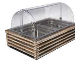
Kühlvitrine Natchez 6,5 cm Edelstahl 2 x 1/2 57.5x37x27.7 cm (LxBxH) vintage weiß/ transparent/edelstahl 30067113