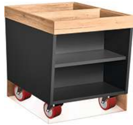
Buffettisch Valinta Inselelement klein fahrbar 72.2x81x93.2 cm (BxHxT) anthrazit/eiche 30134128