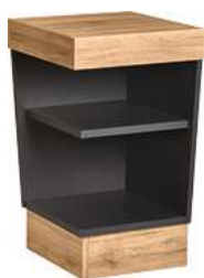
Buffettisch Valinta Eckelement 47.5x81x47.5 cm (BxHxT) anthrazit/eiche 30129656

Ebenfalls aus robustem, pflegeleichtem Holzwerkstoff gebaut, bildet das kleinste Element der Serie den Abschluss für Ihre Buffetstrecke. Es dient sowohl als Innen- oder Außeneck, um Ihr Buffet flexibel fortzusetzen. Der Boden und der festinstallierte Fachboden im Korpus bieten zusätzlichen Stauraum für Teller, Tassen und weitere Utensilien. Ebenso wie die anderen Elemente, ist auch der Ecktisch mit vier höhenverstellbaren Sockelgleitern ausgestattet. Außerdem ist das Eckelement in einer XL-Variante erhältlich, die durch ein erweitertes Tiefenmaß und einer optional wählbaren Rollenfunktion überzeugt.