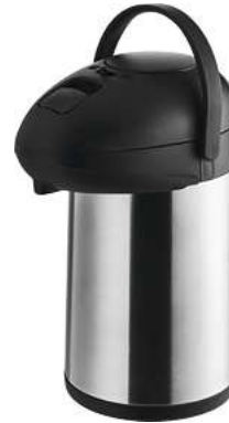
Pump-Isolierkanne Lomé 17x34 cm (ØxH) 3 l silber 30045339