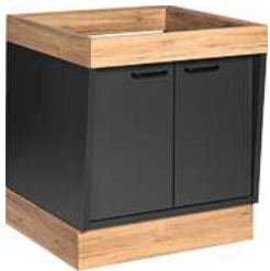
Buffettisch Valinta XL Wandelement klein mit Türen 72.2x81x70 cm (BxHxT) anthrazit/eiche 30222566