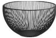
Brotkorb Fraser 25x14 cm (ØxH) schwarz 30047209