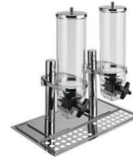
Müslidispenser Hamshire doppelt GN 1/1 53x32.5x56.2 cm (LxBxH) 8 l silber 30045354