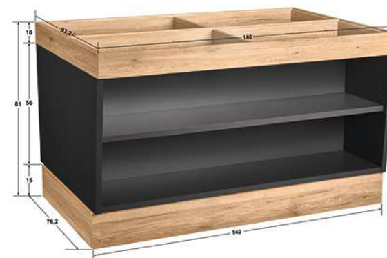
Buffettstisch Valinta XL Wandelement groß 140x81x70 cm (BxHxT) anthrazit/eiche 30222562

Einlegeplatten optional mit und ohne Ausschnitt (separat erhältlich, siehe Seite 22).