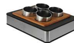
Besteckköcher Fundale anthrazit 1/2 42.5x31.5x50.5 cm (LxBxH) anthrazit/buche/ edelstahl 30067272