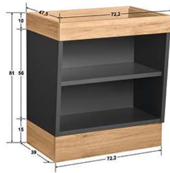
Buffettisch Valinta Wandelement klein 72.2x81x47.5 cm (BxHxT) anthrazit/eiche 30129666

Die Basis-Elemente sind in zwei Längen verfügbar und bilden mit verschiedenen Ausführungen und dem passenden Eckelement die perfekte Lösung für ihre Buffetstrecke.