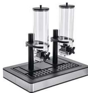
Müslispender Fundale anthrazit doppelt 1/1 63x42.5x50.5 cm (LxBxH) anthrazit/transparent/ schwarz 30232483