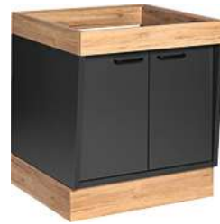
Buffettisch Valinta XL Wandelement klein mit Türen 72.2x81x70 cm (BxHxT) anthrazit/eiche 30222566