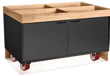
Buffettisch Valinta Inselelement groß fahrbar mit Türen 140x81x93.2 cm (BxHxT) anthrazit/eiche 30232482