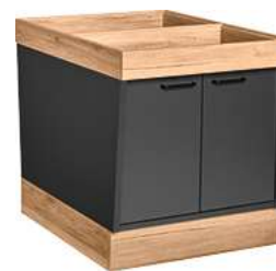
Buffettisch Valinta Inselement klein mit Türen 72.2x81x93.2 cm (BxHxT) anthrazit/eiche 30232475