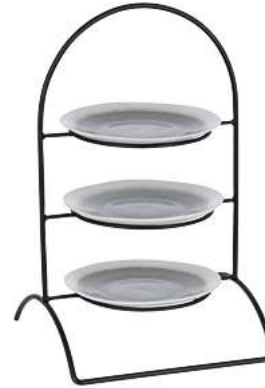
Teller-Etagere Owosso 3-stufig 30.8x50.8x30.4 cm (BxHxT) schwarz 30055854 (ohne Teller)