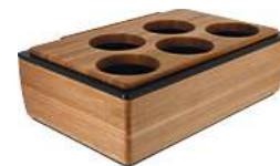
Schalendisplay Montana eiche für 5 Schalen 1/1 57x36.5x18.5 cm (LxBxH) eiche/transparent 30067137