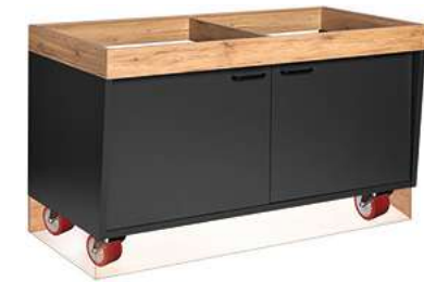
Buffettisch Valinta XL Wandelement groß fahrbar mit Türen 140x81x70 cm (BxHxT) anthrazit/eiche 30222571