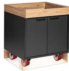
Buffettisch Valinta XL Wandelement klein fahrbar mit Türen 72.2x81x70 cm (BxHxT) anthrazit/eiche 30222568