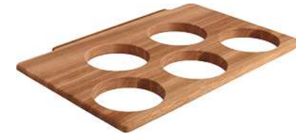
Schalenaufsatz für 5 Schalen Ø 14 cm 53x34x2.5 cm (LxBxH) eiche 30033042