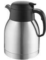
Isolierkanne Rita 14.1x18 cm (ØxH) 1 l silber 10049324