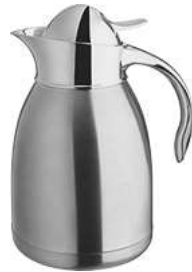
Isolierkanne Gerro 13.6x23.5 cm (ØxH) 1.5 l silber 10008927