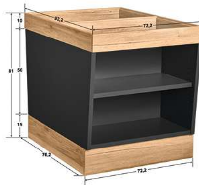
Buffettisch Valinta Inselement klein 72.2x81x93.2 cm (BxHxT) anthrazit/eiche 30129665