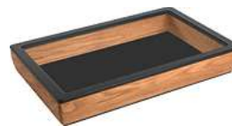
Grundbox Montana flach GN 1/1 57x36.5x8.5 cm (LxBxH) eiche 30002393