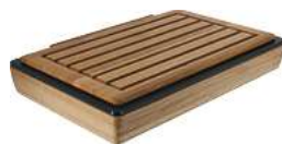
Brotschneidestation Montana eiche 1/1 57x36.5x11 cm (LxBxH) eiche/transparent 30067167