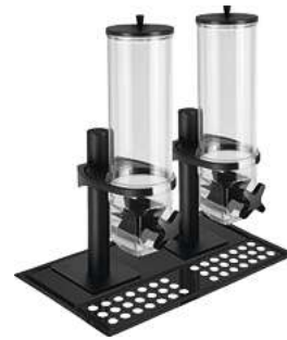
Müslidispenser Hamshire doppelt GN 1/1 53x32.5x56.2 cm (LxBxH) 8 l schwarz 30188238