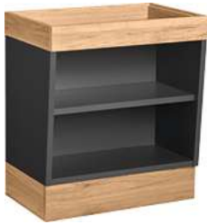
Buffettisch Valinta Wandelement klein 72.2x81x47.5 cm (BxHxT) anthrazit/eiche 30129666