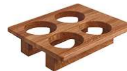
Aufsatz für Besteck- köcher GN 1/2 32.5x26.5x7.2 cm (LxBxH) eiche 30033054