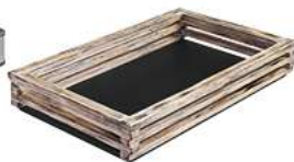
Grundbox Natchez flach GN 1/1 57.5x37x8.8 cm (LxBxH) vintage weiß 30025914