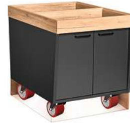
Buffettisch Valinta Inselement klein fahrbar mit Türen 72.2x81x93.2 cm (BxHxT) anthrazit/eiche 30232477